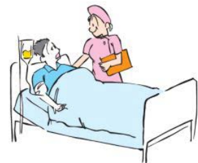
活動中急に心臓が苦しくなり入院

※1. 行事参加者とは、主催者が指定する者、および活動関係者（役員・ボランティア）をいいます。