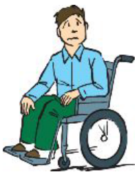
ケガをして後遺障害が残った