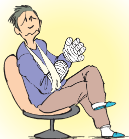
ケガをして後遺障害が残った